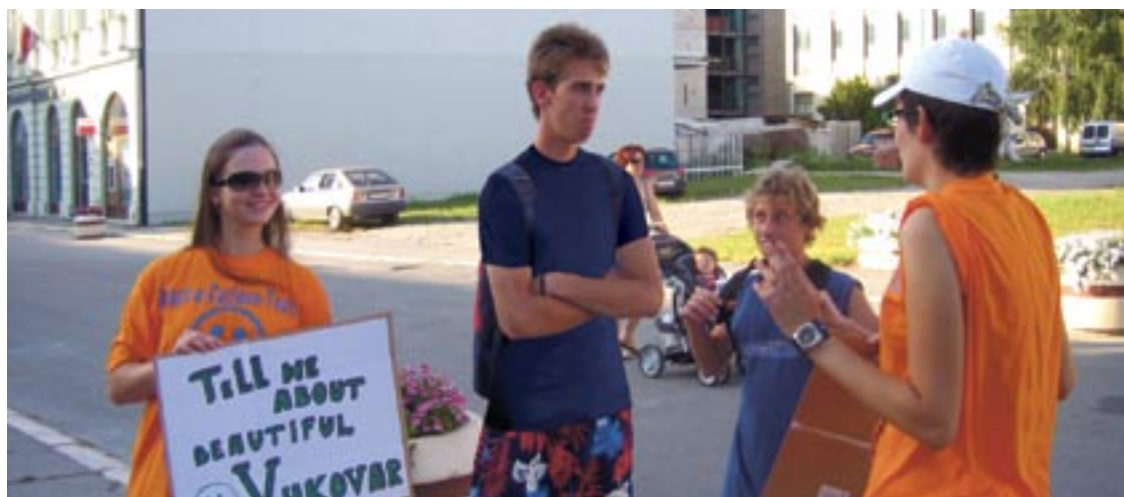
SLIKA 7: MEĐUNARODNA LJETNA ŠKOLA U VUKOVARU

U vrijeme porasta svijesti o važnosti uključivanja šire društvene zajednice u razvoj gradova i općina od posebne državne skrbi KONČAR je donirao novčana sredstva za projekt Međunarodne ljetne škole GPACKT u Vukovaru. GPACKT je program koji se uspješno provodi u Hrvatskoj od 2004. godine, sa svrhom edukacije o metodama uključivanja građanstva u aktivno bavljenje zajednicom u kojoj žive. Međunarodnu ljetnu školu organizirao je PushLAB, centar za inovativnu edukaciju i građanski aktivizam, a svrha škole bila je osmišljavanje projekata koji će oplemeniti život zajednice grada Vukovara.