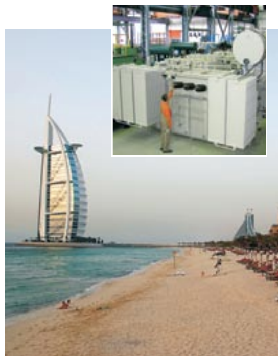
SLIKA 1: U.A.E. ENERGETSKI TRANSFORMATOR ZA FEWA