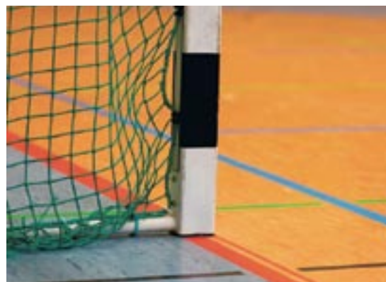
SLIKA 9: POTPORA KOLEKTIVNIM SPORTOVIMA

Rukometni klub „Sesvete“ u 2009. godini imao je preko dvjesto aktivnih igračica i pet ekipa u natjecanju na nivou Hrvatske. Za mlade uzrasne kategorije organiziran je i tradicionalni Božićni turnir na kojem je sudjelovalo 24 ekipa iz cijele Hrvatske. Klub je sudjelovao i na Uskrsnom turniru u Sinju te turniru povodom Dana Sv. Nikole u Varaždinu. Osim natjecateljskih ekipa, klub radi sa šest škola rukometa na području Sesveta.