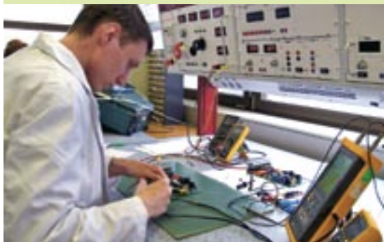
SLIKA 15: KONČAR - ELEKTRONIKA I INFORMATIKA

Tijekom 2009. godine započeto je istraživanje organizacijske klime u društvima KONČAR. Cilj istraživanja je ispitati organizacijsku klimu u svim društvima KONČAR kako bi se dobio prikaz klime na razini koncerna. Klima posredno ili neposredno utječe na efikasnost ili produktivnost organizacije, njenu inovativnost te na zadovoljstvo poslom, odnosno ona utječe na procese kao što su komunikacija, rješavanje problema, donošenje odluka, upravljanje konfliktima, učenje i motivaciju.