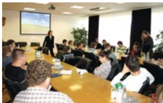
SLIKA 17: SEMINAR ZA PRIPRAVNIKE

Razvijena je i suradnja s fakultetima, napose s Fakultetom elektrotehnike i računarstva, zatim Tehničkim veleučilištem, Ekonomskim fakultetom, Pravnim fakultetom itd. Osim što (zaposlenici KONČARA) sudjeluju u obrazovnom procesu, iz KONČARA se regrutiraju i predavači za pojedine predmete na dodiplomskim, specijalističkim i poslijediplomskim studijima. KONČAR sudjeluje i u aktivnostima prezentiranja tvrtki studentima pojedinih fakulteta.