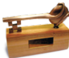
SLIKA 3: NAGRADA ZLATNI KLJUČ

KONČARU je dodijeljena za niskopodni elektromotorni vlak