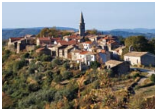
SLIKA 11: MEĐUNARODNI KULTURNI CENTAR HRVATSKE GLAZBENE MLADEŽI U GROŽNJANU