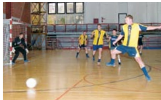
SLIKA 21: MALONOGOMETNI TURNIR