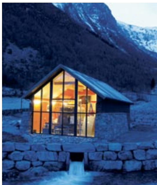
SLIKA 22: MHE STEINVIK, NORVEŠKA

Sva društva u KONČARU koja djeluju na tržištu posjeduju certifikate ISO 9001. Za područje odgovornosti za proizvod odgovorni su direktori pojedinih društava. Na razini Matice dio odgovornosti snose i članovi Uprave zaduženi za pojedina poslovna područja.