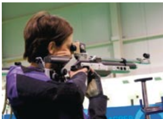
SLIKA 8: STRELJAČKO DRUŠTVO KONČAR - ZAGREB 1786

Streljačko društvo „KONČAR - Zagreb 1786“ osnovano je 1948. godine i sljedbenik je Prvog građanskog streljačkog društva registriranog 1786. godine. Od 1993. godine nosi naziv KONČAR, a ove je godine proslavljeno petnaest godina uspješne suradnje KONČARA i streljačkog društva.