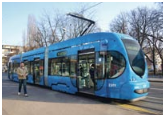
SLIKA 12: NISKOPODNI TRAMVAJ

Projekti u području opskrbe električnom energijom (postrojenja za proizvodnju, prijenos i distribuciju električne energije) i javnog prijevoza (željeznica i tramvaj) podižu kvalitetu života i imaju šire značenje za zajednicu.