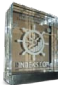
SLIKA 2: INDEKS DOP-A