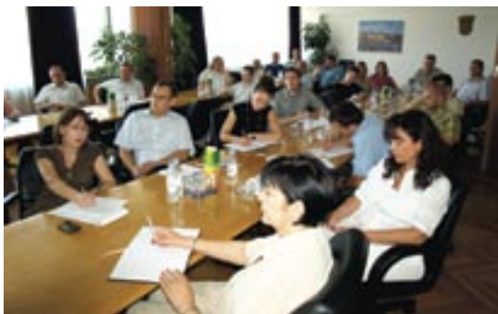
SLIKA 19: OBRAZOVANJE ZA MLADE MENADŽERE

Program obrazovanja započeo je 2008. godine, a nastavljen u 2009 godini. Edukacija je bila na engleskom jeziku tijekom 21 dana, podijeljenih na sedam modula po tri dana s obrađenih 20 tema koje je predavalo 14 inozemnih i dva hrvatska predavača. Teme su uključile najvažnija znanja o vođenju projekata, organizaciji