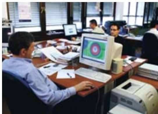
SLIKA 14: TEHNIČKI URED KONČAR - ELEKTRIČNA VOZILA

Trendovi u području radne snage indiciraju da se priljev uglavnom odnosi na novo zapošljavanje mladih i visokoobrazovanih radnika, a odljev se uglavnom odnosi na odlazak u mirovinu i manje zahvate restrukturiranja u pojedinim trgovačkim društvima.