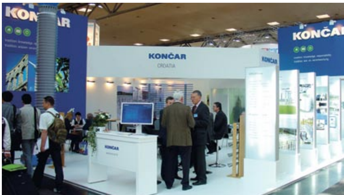
SLIKA 23: IZLOŽBENI PROSTOR KONČARA NA SAJMU

Primjena Kodeksa etike u poslovanju, čiji je potpisnik KONČAR - Elektroindustrija d.d., obvezuje i na odgovorno marketinško komuniciranje. U programima marketinške komunikacije KONČAR se prvenstveno obraća ciljnim skupinama korisnika, naglašavajući kvalitetu proizvoda i reference i proizvodne mogućnosti Grupe, uz maksimalno poštivanje zakona, standarda i dobrovoljnih kodeksa koji se odnose na marketinške komunikacije. Pritom se ne koriste neistinite i uvredljive činjenice koje mogu povrijediti bilo koji segment ili grupu, uključujući konkurenciju. Osim vlastitih mogućnosti, promoviraju se i opće društvene vrijednosti koje potiču na tehnološki, ekonomski i društveni razvoj.