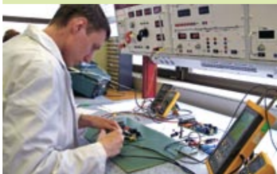
SLIKA 15: KONČAR - ELEKTRONIKA I INFORMATIKA

Tijekom 2009. godine započeto je istraživanje organizacijske klime u društvima KONČAR. Cilj istraživanja je ispitati organizacijsku klimu u svim društvima KONČAR kako bi se dobio prikaz klime na razini koncerna. Klima posredno ili neposredno utječe na efikasnost ili produktivnost organizacije, njenu inovativnost te na zadovoljstvo poslom, odnosno ona utječe na procese kao što su komunikacija, rješavanje problema, donošenje odluka, upravljanje konfliktima, učenje i motivaciju.