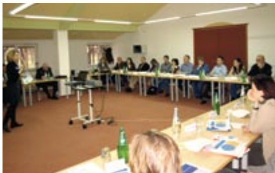
SLIKA 20: RADIONICA O INTERNOJ KOMUNIKACIJI

U KONČARU u 2009. godini kao i ranijih godina, nisu zabilježeni slučajevi diskriminacije na osnovi spola, rase, dobi, nacionalne pripadnosti, političkih ili vjerskih uvjerenja ili drugih primjenjivih kriterija. Pri upravljanju ljudskim resursima i donošenju drugih relevantnih poslovnih odluka poštuju se načela jednakopravnosti i ujednačenih kriterija.