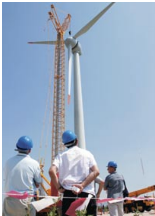
SLIKA 16: VJETROAGREGAT U IZGRADNJI

U skladu sa Zakonom o zaštiti na radu, u svim društvima je određeni broj radnika osposobljen za pružanje prve pomoći. Na svakih 50 radnika osposobljen je jedan radnik za pružanje prve pomoći. Zbog dobro organiziranog sustava sigurnosti i zaštite na radu, o čemu svjedoči i niska stopa ozljeda i slučajeva profesionalne nesposobnosti, nisu zabilježene potrebe za daljnjim širenjima programa savjetovanja, prevencije i kontrole rizika. Također, u skladu s kolektivnim ugovorom i pravilnicima o radu društava predviđena je novčana pomoć u slučaju teže bolesti i smrti članova uže obitelji.