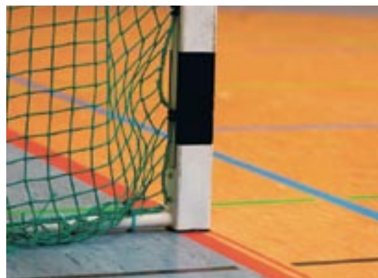
SLIKA 9: POTPORA KOLEKTIVNIM SPORTOVIMA

Rukometni klub „Sesvete“ u 2009. godini imao je preko dvjesto aktivnih igračica i pet ekipa u natjecanju na nivou Hrvatske. Za mlade uzrasne kategorije organiziran je i tradicionalni Božićni turnir na kojem je sudjelovalo 24 ekipa iz cijele Hrvatske. Klub je sudjelovao i na Uskrsnom turniru u Sinju te turniru povodom Dana Sv. Nikole u Varaždinu. Osim natjecateljskih ekipa, klub radi sa šest škola rukometa na području Sesveta.