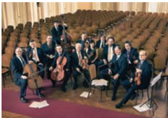
SLIKA 10: ANSAMBL ZAGREBAČKI SOLISTI

Tijekom 55 godina, koliko djeluje, ansambl Zagrebački solisti ostavio je neizbrisiv trag u hrvatskoj kulturnoj baštini. Osnovan je 1953. godine u okviru Radio-televizije Zagreb i do danas su ostali prisutni na prestižnim svjetskim koncertnim podijima. Do sada su održali više od 3000 koncerata na svim kontinentima, a redovito gostuju i na najpoznatijim glazbenim festivalima. KONČAR je i u prošlosti podupirao ansambl Zagrebačkih solista, a u 2009. godini to je izrazio kroz novčano sponzorstvo sezone.