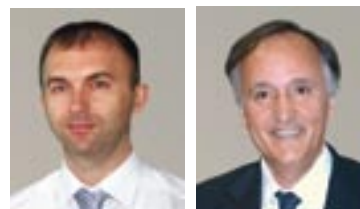
SLIKA 18: NOVI DOKTORI ZNANOSTI U 2009. GODINI