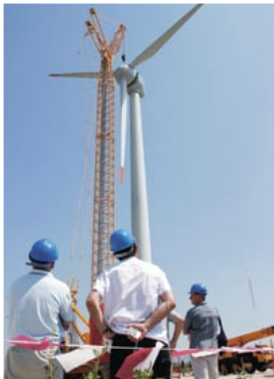
SLIKA 16: VJETROAGREGAT U IZGRADNJI

U skladu sa Zakonom o zaštiti na radu, u svim društvima je određeni broj radnika osposobljen za pružanje prve pomoći. Na svakih 50 radnika osposobljen je jedan radnik za pružanje prve pomoći. Zbog dobro organiziranog sustava sigurnosti i zaštite na radu, o čemu svjedoči i niska stopa ozljeda i slučajeva profesionalne nesposobnosti, nisu zabilježene potrebe za daljnjim širenjima programa savjetovanja, prevencije i kontrole rizika. Također, u skladu s kolektivnim ugovorom i pravilnicima o radu društava predviđena je novčana pomoć u slučaju teže bolesti i smrti članova uže obitelji.